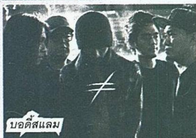
บอดีส์แลม