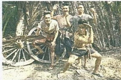
แก๊งเพื่อนพี่มาก