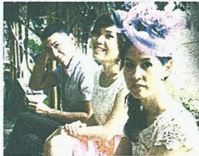
3 พิธีกร "เทย เทียว ไทย"

ทั้งนี้ ศิลปินสุดฮิตที่ได้รับการ เสนอชื่อให้เข้าชิงมากที่สุดถึง 4 สาขา คือ